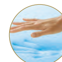
VISCOELÁSTICA CON GEL