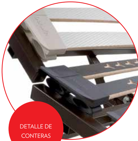
DETALLE DE CONTERAS