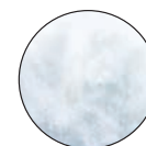
ACOLCHADO CON FIBRAS HIPOALERGÉNICAS