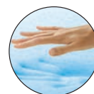
VISCOELÁSTICA CON GEL