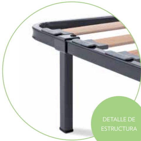
DETALLE DE ESTRUCTURA