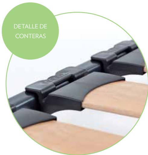
DETALLE DE CONTERAS